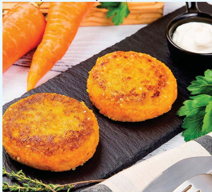
КОЧКЫШДА ПЕРКАН ЛИЙЖЕ!