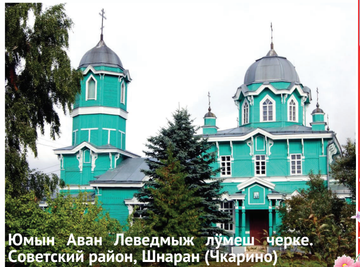
Юмын Аван Леведмыж лумеш черке. Советский район, Шнаран (Чкарино)

Эн Святой Яндар Ёдыр, Тыйым моктена да чапле Леведышетым жаплена. Вет мемнан верч кумал шогыметым святой Андрей южышто ужын.